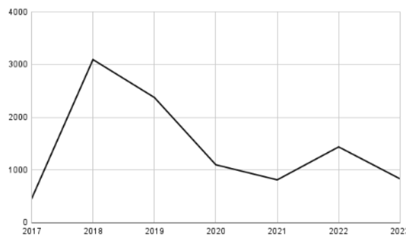
Figura 1: Série histórica dos atendimentos realizados pelo fisioterapeuta utilizando auriculoterapia na atenção básica no Piauí. Parnaíba, 2024

Ao analisar a série histórica dos sete anos registrados no SISAB (figura 1), identificou-se um expressivo crescimento de 2017 a 2018, atingindo o ápice no ano de 2018, ultrapassando quantitativos brutos de 3.000 atendimentos de auriculoterapia na AB do Piauí por fisioterapeutas. Após o pico de 2018, houve uma queda gradual a cada ano até 2021. Os atendimentos obtiveram um crescimento acentuado de 2021 a 2022, porém já a partir de 2022 houve novamente um declínio nos dados informados.